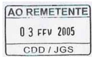
figura 8 Dimensões: 4x2,3cm

Um motivo não previsto no citado Manual de Distribuição é “CAIXA POSTAL CANCELADA” (figura 9). Esse motivo poderia ser escrito no espaço em branco que há no carimbo de devolução (figura 5), entretanto deve ser um motivo bastante comum, pois temos carimbo especial para essa situação em São Paulo.