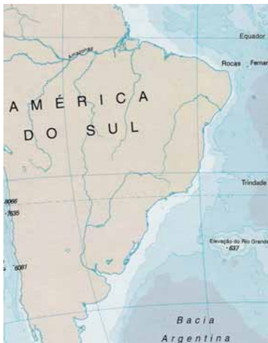
Mapa parcial da América do Sul, indicando a posição da ilha da Trindade.

Retornando a Paris, em 1893, enviou uma proclamação a vários países, noticiando a criação do Principado Independente de Trindade. Chegou a instalar uma chancelaria em Nova York. Propunha colonizar a ilha para cultivar as artes e ciências. Projetou também um sistema postal.