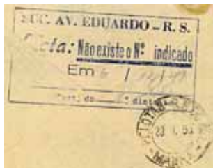
figura 1A Verso parcial

Outros, exclusivos para “Mudou-se s/ comunicar” (figura 2) e “Não mora no endereço indicado” (figura 3), aparecem