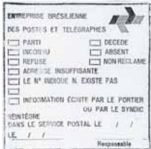
figura 6 Dimensões: 6,2x6,2cm