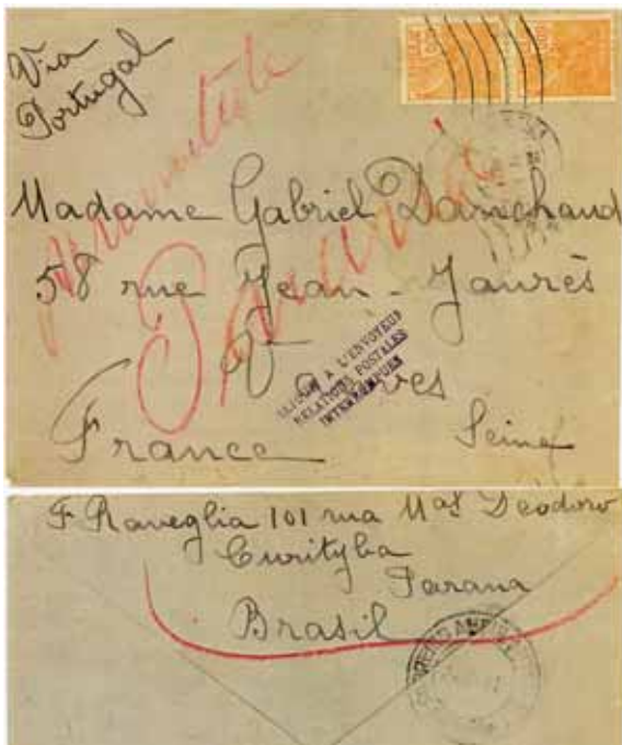
figura 10 - Frente e verso

capítulo novo a ser explorado pelos filatelistas na História Postal. Muitas vezes os envelopes percorrem caminhos tortuosos até voltarem aos seus proprietários (remetentes). Descobrir tais caminhos e as causas do seu retorno nos faz viajar com esses envelopes.