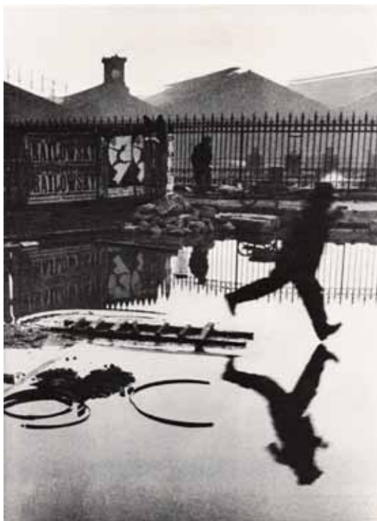
Famosa foto de Henri Cartier-Bresson, em que ele mostra sua notável capacidade de composição.