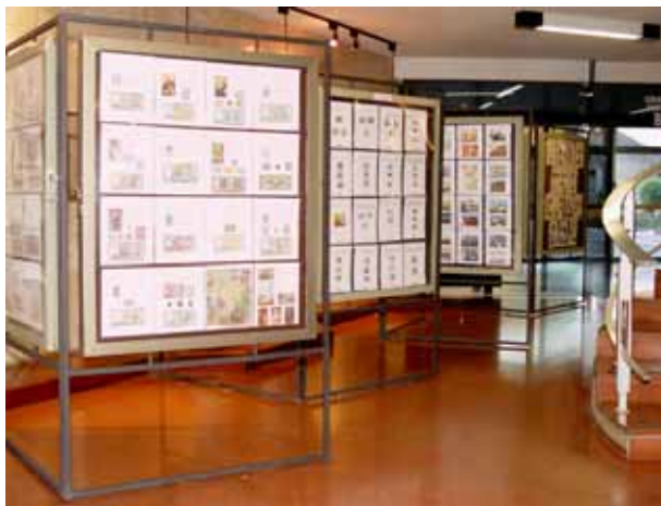
Panorâmica parcial da I Mostra Filatélica e de Telecartofilia, no Hall de entrada da Sede da Brasil Telecom, em Florianópolis.