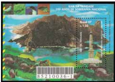
Bloco alusivo aos 100 anos de soberania nacional sobre a ilha da Trindade, emitido pelos Correios em 07/05/1997.

De acordo com publicações da época, que denunciaram a fraude, foram emitidos selos com desenho parecido com o do selo de 18c de Bornéu Setentrional de 1894.