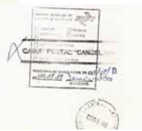
figura 9A Verso parcial