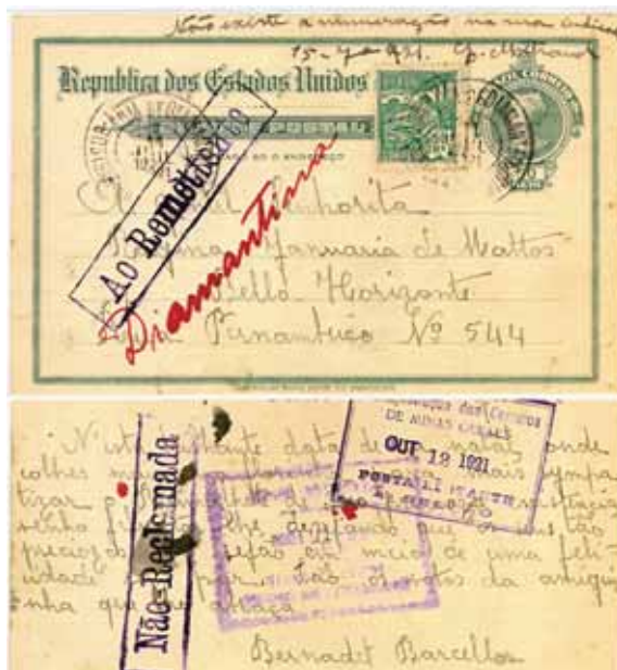
figura 4 Frente e verso

mais dois: “AUSENTE” e “NÃO PROCURADO”. Há um espaço em branco para um motivo diferente desses e há, também, um espaço para assinalar se a informação foi escrita pelo porteiro ou síndico.