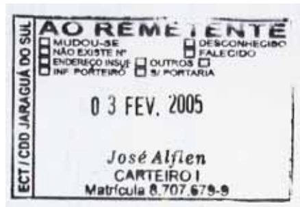
figura 7 Dimensões: 6x4cm