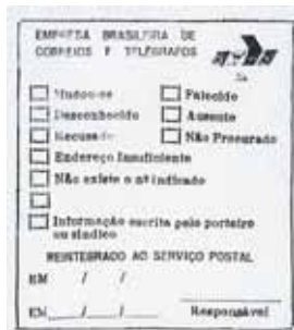
figura 5 Dimensões: 4,7x5,3cm