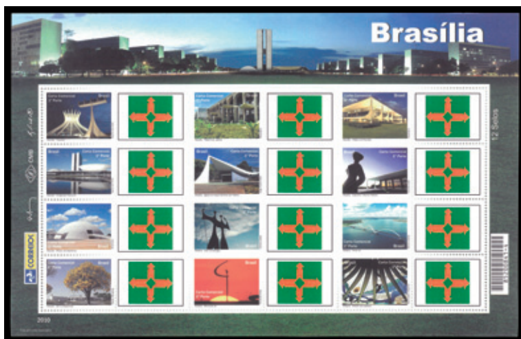
RHM C-2940 a C-2951