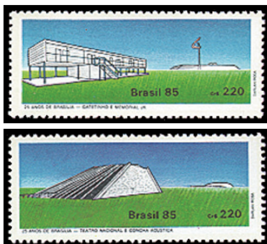
RHM C-1451 e RHM C-1452