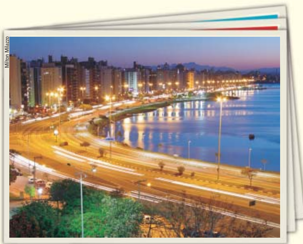
Av. Beiramar Norte - Florianópolis - SC