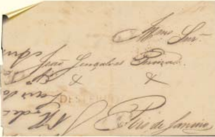
◀ Pré-filatélico de Desterro para o Rio de Janeiro, com legenda em castanho avermelhado e tarifa de 40rs. Coleção Peter Meyer

O condutor que levava a mala postal a Laguna, levava conjuntamente aquela dirigida a Porto Alegre, saindo nos dias 13 e ante-penúltimo dia de cada mês. Para o norte e demais pro-