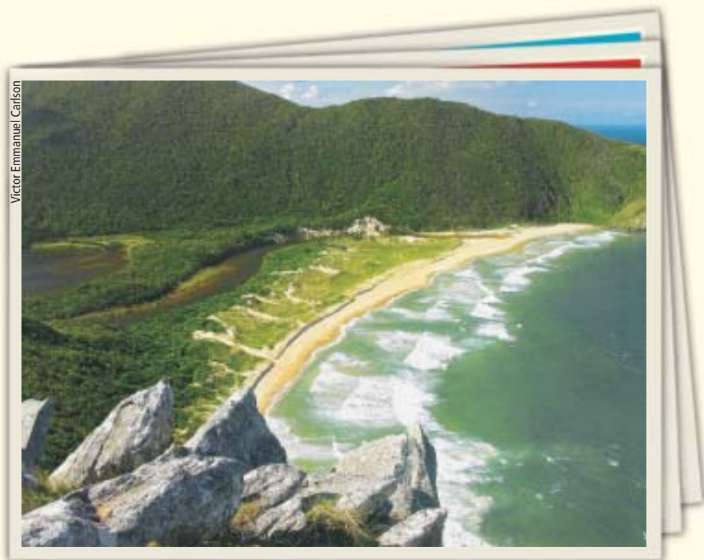
Praia da Lagoinha do Leste - Florianópolis - SC