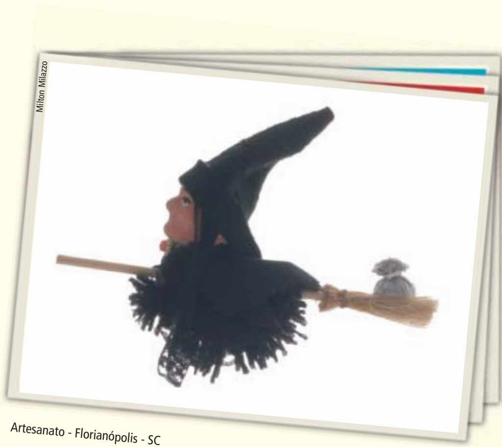
Artesanato - Florianópolis - SC