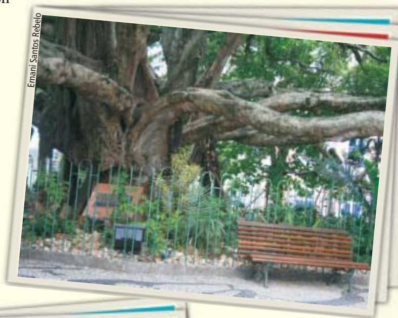
Figueira da Praça XV de Novembro - Florianópolis - SC