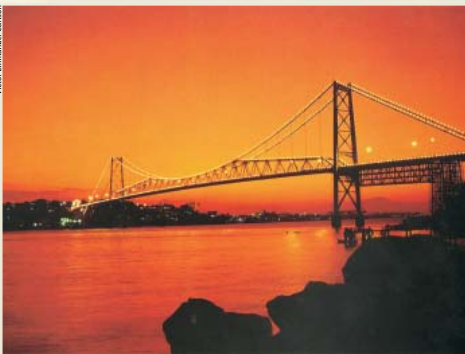
Ponte Hercílio Luz - Florianópolis - SC

Florianópolis apresenta características climáticas inerentes ao litoral sul-brasileiro. As estações do ano são bem definidas. A média das temperaturas máximas do mês mais quente varia de 26°C a 31°C e a média das mínimas do mês mais frio, de 7,5°C a 12°C. A temperatura média anual está em torno de 24°C. A temperatura mais baixa registrada na cidade foi de 2°C negativos, em 1975, e a máxima, de 39°C. Geadas ocorrem esporadicamente no inverno. Devido à proximidade do mar, a umidade relativa do ar é de 80%, em média. A precipitação é bastante significativa e bem distribuída durante o ano. A precipitação normal anual para o período de 1911-1984 foi de 1521mm. Não existe uma estação seca, sendo o verão a estação com maior índice pluviométrico (Hermann et alii, 1986). De abril a dezembro, há pouca variação, com uma média em torno de 100mm mensais. Os valores mais baixos ocorrem de junho a agosto.