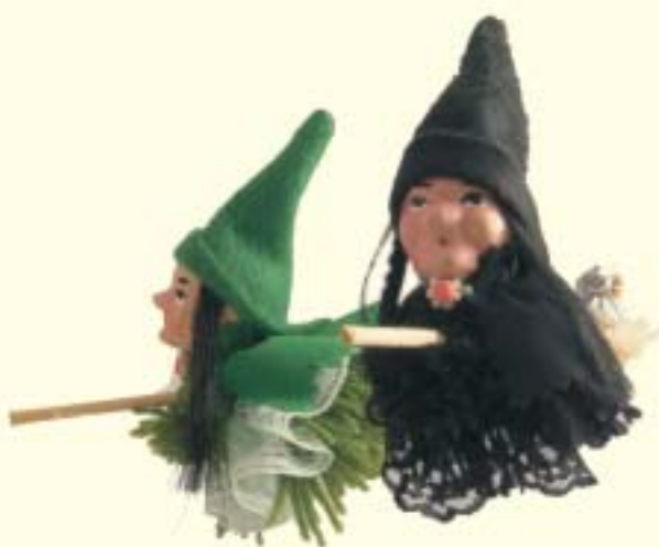
Artesanato - Florianópolis - SC