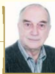
COMISSÁRIO PARA O RIO GRANDE DO SUL ADRIANUS W. VOGELAAR