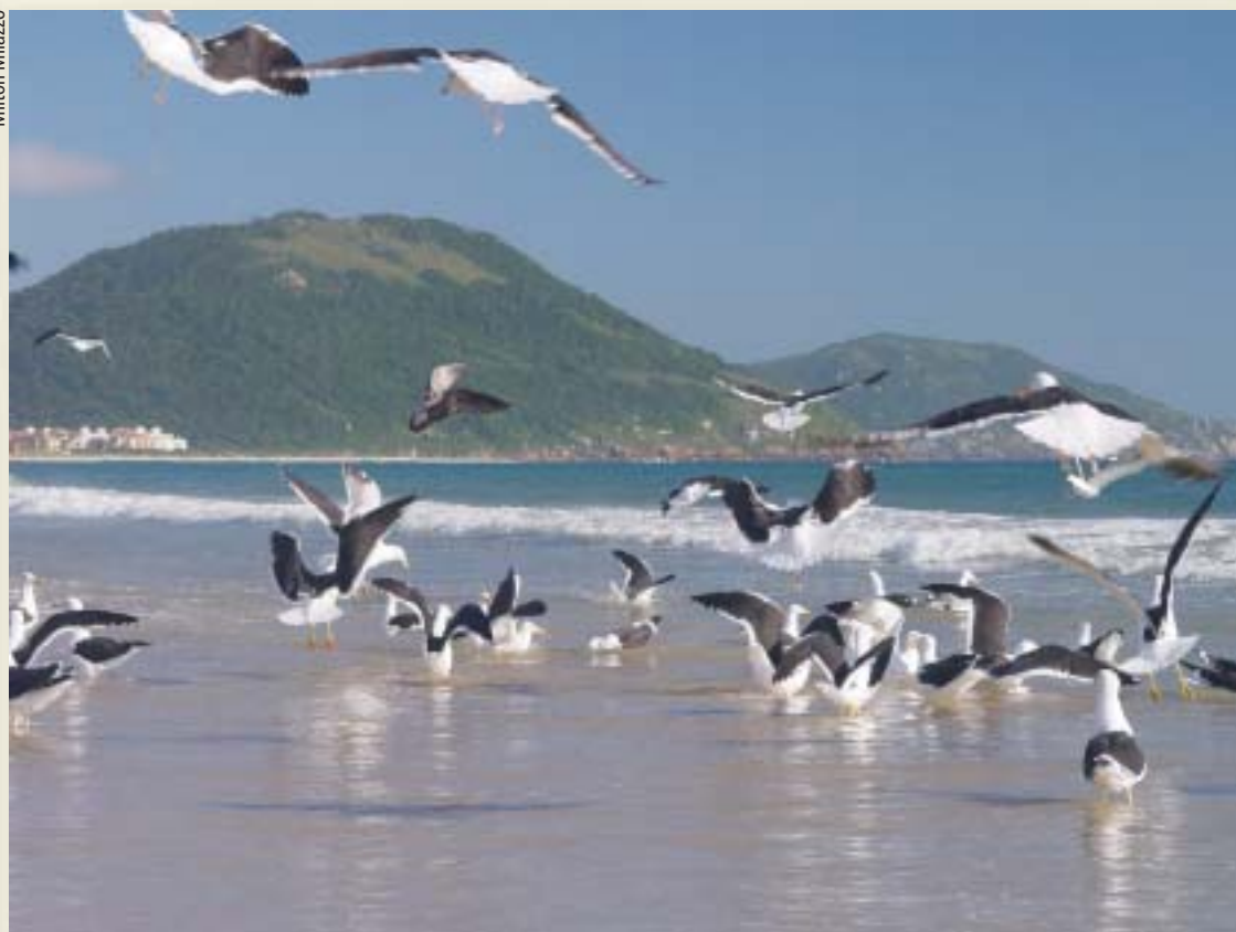
Praia dos Ingleses - Florianópolis - SC