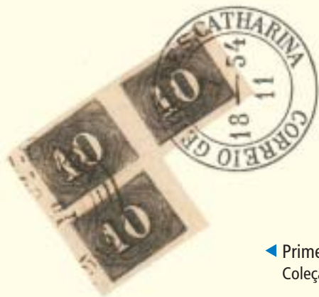
◀ Primeiro carimbo circular com data utilizado no Brasil.

O Real Erário informou à Junta da Real Fazenda da Capitania do Rio Grande de São Pedro do Sul que ordenara pela Provisão de 23 de junho de 1819 que os Almojarifes e seus Escrivães se mantivessem nos cargos de Administradores dos Correios respectivos, como fora estabelecido anteriormente. Os oficiais encarregados do peso das cartas voltariam aos seus serviços nas respectivas Administrações postais, com os