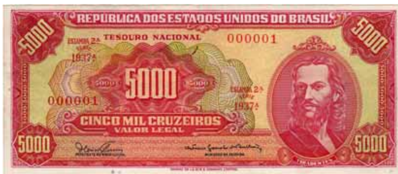
Fig. 2 – Anverso da cédula de 5.000 cruzeiros, impressa pela Thomas de La Rue & Company (TDLR), série 1937ª (BCc 01-BA), com as microchancelas do primeiro Presidente do Banco Central - Dênio Nogueira e do Ministro da Fazenda - Octávio Gouvêa de Bulhões.

A primeira cédula do Banco Central da República do Brasil foi a de 5.000 cruzeiros, aproveitada do Tesouro Nacional (séries 1701 a a 2200 a ), fabricada pela Thomas de La Rue & Company , contendo as microchancelas do seu Presidente, Dênio Nogueira (13.4.1965 a 21.3.1967), em substituição a do Diretor da Caixa de Amortização, Sérgio Augusto Ribeiro. O Ministro da Fazenda permaneceu o mesmo, qual seja, Octávio Gouvêa de Bulhões (4.4.1963 a 16.3.1967).