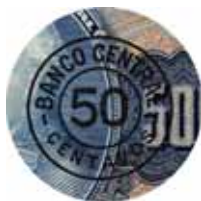
Fig. 10 – Detalhe da cédula de 50 centavos (BCc 06AA1a), superimpressão circular em preto sobre a cédula de 100 cruzeiros, aproveitada da 1ª Estampa do Tesouro Nacional.

Período de circulação: ... 1967 a 30/06/1973 (Resolução nº 217, de 23/03/72; Carta Circular nº 87, de 10/05/73).