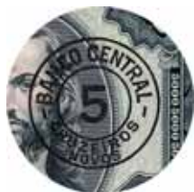
Fig. 12 – Detalhe da cédula de 5 cruzeiros novos (BCc 08-AA2a), superimpressão circular em preto sobre a cédula de 5000 cruzeiros, aproveitada da 1ª Estampa do Tesouro Nacional.

Período de circulação: ... 1967 a 30/06/1974 (Resolução nº 258, de 17/05/73; Resolução nº 287, de 16/05/74; Comunicado, de 27/05/74 e Carta Circular nº 114, de 27/05/74).