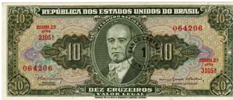
Fig. 5 – Averso da cédula de 1 centavo do Banco Central; essa emissão em cruzeiros novos utilizou cédulas aproveitadas do Tesouro Nacional que estavam em estoque – cédulas de 10 cruzeiros (séries 3056ª a 4055ª), através de superimpressão, realizada pela filial da Thomas de La Rue, no Rio de Janeiro.