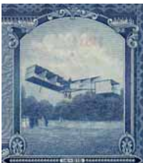
Fig.1 – Detalhe do reverso da cédula de 10.000 cruzeiros da 1ª estampa (BCc 02-AA) 1 , impressa pela American Bank Note Company (ABNCo.), retratando o vôo do “14 bis” no Campo de Bagatelle – Paris, em 1906.

Em 1964, o Brasil sofreu um golpe militar e passou a viver um regime de exceção. O retrocesso político viria marcar profundamente o país, sendo que a ditadura durou cerca de duas décadas. Não obstante esse fato, algumas mudanças necessárias que já vinham sendo planejadas foram implementadas, como a capacitação da Casa da Moeda para a impressão de cédulas, a criação de um Banco Central e uma reforma monetária, visando a desindexação do cruzeiro.