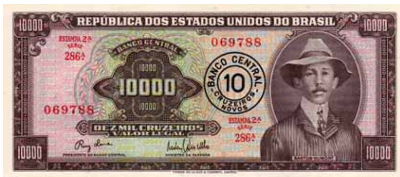
Fig.15 – Anverso da cédula de 10 cruzeiros novos (BCc 09-BA1a), aproveitada da 2ª Estampa do Banco Central.

Em 15 de maio de 1970, entrou em vigor o padrão cruzeiro, com a equivalência de 1 cruzeiro novo para 1 cruzeiro. As últimas cédulas do cruzeiro novo perderam o valor em 30/06/1975.