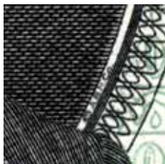
Fig. 5 – Detalhe do averso (ao lado direito do medalhão) da cédula de 10.000 cruzeiros 1ª Estampa (BCc 02-AA), “© A.B.N.Co.”, ou seja, “Copyright – American Bank Note Company”, em microcaracteres. (Imagem ampliada 4 vezes).

A bela cédula de 10.000 cruzeiros tem detalhes que, muitas vezes, escapam aos olhos mais atentos, como este detalhe do medalhão, vejamos: