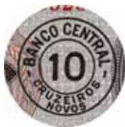
Fig.13 – Detalhe da cédula de 10 cruzeiros novos (BCc 09-AA2a), superimpressão circular em preto sobre a cédula de 10.000 cruzeiros, aproveitada da 1ª Estampa do Banco Central.

Período de circulação: ... 1967 a 30/06/1975 (Resolução nº 287, de 16/05/74; Comunicado, de 27/05/74, Comunicado de 20/02/75 e Circular nº 255, de 16/05/75).