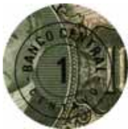
Fig. 7 – Detalhe da cédula de 1 centavo (BCc 03-BA1a), superimpressão circular em preto sobre a cédula de 10 cruzeiros, aproveitada da 2ª Estampa do Tesouro Nacional.

Recebimento das cédulas da empresa impressora: