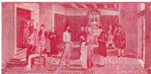
Fig. 3 – Detalhe do reverso da cédula de 5.000 cruzeiros (BCc 01-BA), reprodução do quadro de Rafael Franco de 1941 – “Tiradentes ante ao Carrasco”.