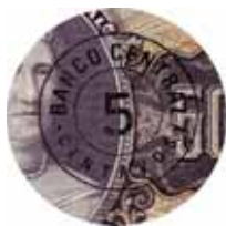
Fig. 8 – Detalhe da cédula de 5 centavos (BCc 04-BA1b), superimpressão circular em preto sobre a cédula de 50 cruzeiros, aproveitada da 2ª Estampa do Tesouro Nacional.

Período de circulação: ... 1966 a 30/06/1972 (Resolução n° 187, de 20/05/71; Carta Circular n° 59, de 6/04/72 e Comunicado MECIR s/n°, de 27/04/72)